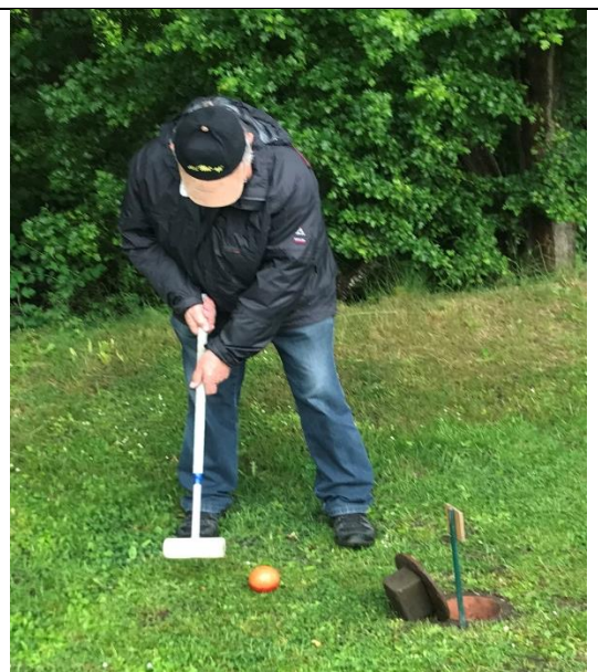
Forf... kuglen ligger bag låget til hullet 😊