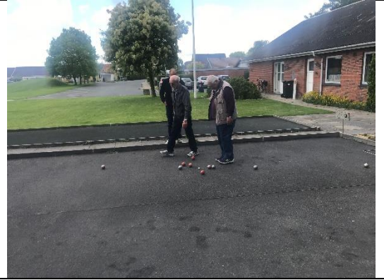
Point vurderes og optælles